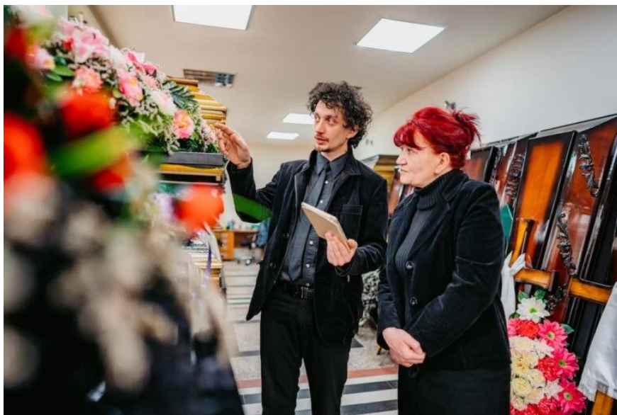
Cambiano i riti funebri e diventano più tecnologici

Essi, infatti, non solo hanno cominciato ad affiancare quelli reali , ma spesso li sostituiscono essendo decisamente molto utili per chi non riesce o preferisce non partecipare alle funzioni. In pratica, parenti, amici e conoscenti postano direttamente dal proprio computer di casa o dallo smartphone in lungo digitale specifico foto, video, poesie e pensieri dedicati al defunto. La digitalizzazione dei funerali vede anche un altro trend in forte espansione: le cerimonie in diretta streaming .