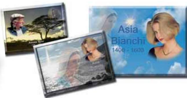
Fotolapidi in porcellana

ingredienti: le pregiatissime materie prime utilizzate, la cura maniacale dei dettagli, l'estro, la professionalità e l'attenzione di uno staff tecnico costituito prevalentemente da donne.