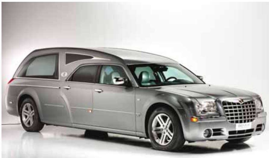
La Biemme Madison, presentata da Biemme Special Cars ad ottobre 2008 e in breve tempo diventata l'ammiraglia più apprezzata da molte importanti imprese funebri italiane

Il 2010 si annuncia come l'anno di una svolta epocale per il mercato italiano ed internazionale delle autofunebri: tutti i più importanti autotrasformatori del nostro Paese sono al lavoro per presentare i nuovi modelli , progettati e realizzati sull'innovativo telaio Mercedes a passo lungo . Tenendo fede ad una leadership ormai consolidata all'interno della propria categoria, Biemme Special Cars proporrà a Tanexpo 2010, oltre all'intera gamma attualmente in produzione, una vettura naturalmente destinata a diventare la protagonista incontrastata dei prossimi anni , rinnovando i fasti del passato per un Marchio che ha costruito il proprio successo sulla qualità , sulla eleganza e sulla più assoluta affidabilità .