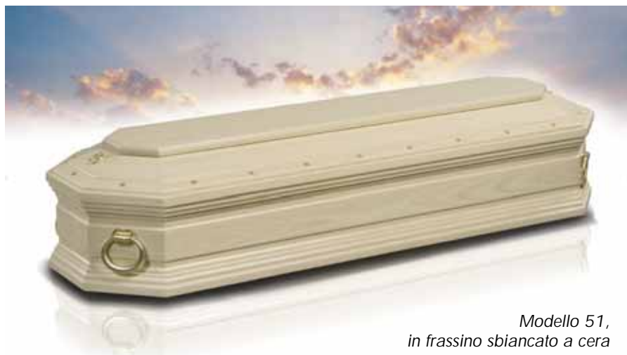
Modello 51, in frassino sbiancato a cera

È nello stile di Scacf il gusto dell'ospitalità: lo sanno bene i tanti Operatori Funebri italiani che ogni giorno visitano il complesso industriale di San Giustino per vedere direttamente non solo le ultime novità , ma anche l'intero ciclo produttivo da cui traggono origine cofani funebri ormai riconosciuti in tutto il mondo come eccezionale testimonianza del "made in Italy" . E che, alla fine di una giornata di lavoro, vivono un gradevolissimo momento conviviale nella rilassante sosta in un centro benessere o