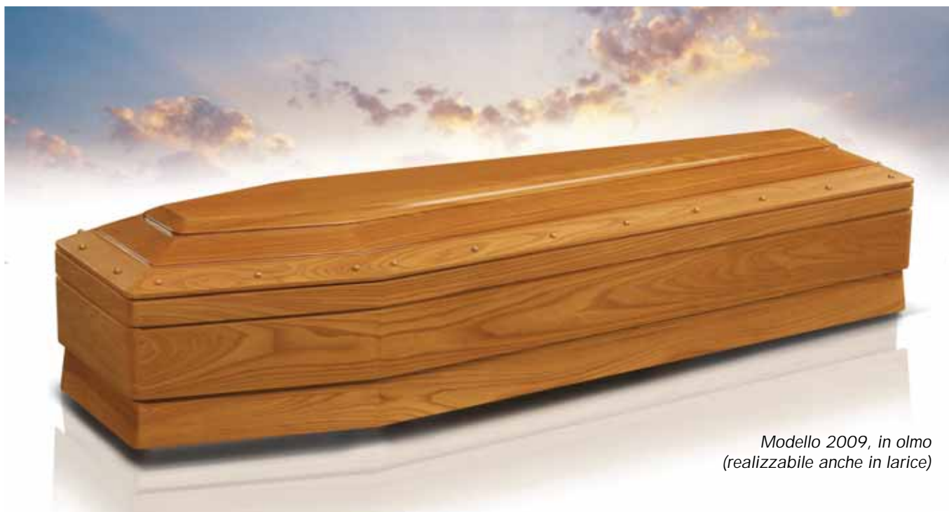
Modello 2009, in olmo (realizzabile anche in larice)

catalogo in grado di soddisfare qualsiasi esigenza. Modelli, essenze, colori, tecniche di verniciatura : tutto nel segno di quella "qualità totale" che da sempre rappresenta il più importante tratto distintivo dell'azienda umbra.