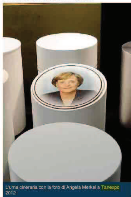
L'urna cineraria con la foto di Angela Merkel a Tanexpo 2012

Angela Merkel è andata alle urne, a sua insaputa. Un'azienda di Como ha scelto il sorriso del Cancelliere tedesco come immagine di prova a TanExpo 2012, la fiera del settore mortuario a Bologna. In cima a un cilindro bianco, teca da salotto per le ceneri del caro estinto, è spuntata la "regina" di Eurolandia. "Niente contro la Merkel, solo una trovata pubblicitaria", spiegano allo stand.