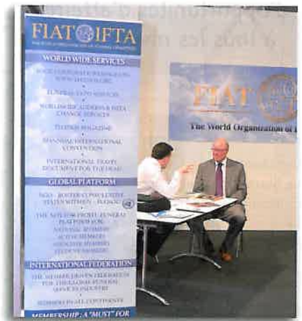
Le stand de la FIAT-IFTA.

... la qualité des stands ainsi que par la richesse des produits et des nouveautés présentées