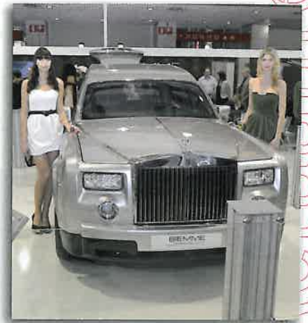
Les anglaises à l'honneur sur le stand Pilato et Biemme.

Tous, et plus particulièrement les exposants étrangers, ont été séduits, non seulement par l'accueil qui leur a été réservé, notamment lors de la soirée organisée en leur honneur dans le cadre somptueux du "Palazzo Re Enzo" qui a marqué les esprits, mais aussi par la douceur du climat - chose plutôt habituelle en Italie - et surtout, sur le plan professionnel, par la qualité des stands ainsi que par la richesse des produits et des nouveautés présentées.