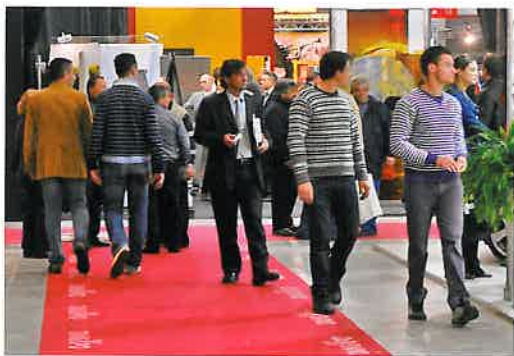
En la pasada edición, celebrada en 2010, la feria fue visitada por cerca de 16.000 visitantes profesionales

Respecto a los retos marcados de cara al futuro del salón, Leanza nos contaba en la mencionada entrevista: “Tanexpo trabaja para lograr un proceso real de crecimiento y desarrollo del sector, el cual merece una mayor consideración de las instituciones debido al papel social fundamental llevado a cabo por los operadores funerarios. En consecuencia, no se debe dudar a la hora de proporcionar a los ciudadanos una información amplia, completa y correcta. En este sentido, deseamos que disfruten de un evento dirigido al público en general, y no sólo a los profesionales del sector, una conexión entre la feria y la ciudad para permitir a los ciudadanos profundizar sobre cuestiones relacionadas con la muerte”.