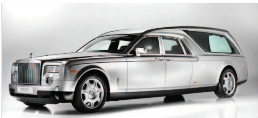
Foto Il carro funebre di lusso

Anche l'ultimo saluto ai cari si può vivere nel lusso, scegliendo il carro funebre adatto, quello più lussuoso e costoso al mondo per funerali da Guinness. Per farlo si deve ricorrere al Phantom Hearse B12 , creato dall'azienda specializzata Biemme Special Cars di Padova: 500mila euro per il carro funebre che nasce dalla più iconica auto Rolls-Royce , la Phantom . Il veicolo, che sarà mostrato alla TanExpo a Bologna dal prossimo 23 marzo rappresenta il massimo per il settore: un carro funebre che richiama in tutto lo stile della vettura britannica per permettere al caro estinto un ultimo viaggio indimenticabile.