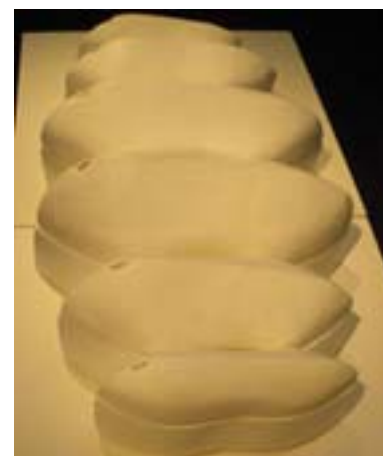
EXPOSICIÓN DE DISEÑO