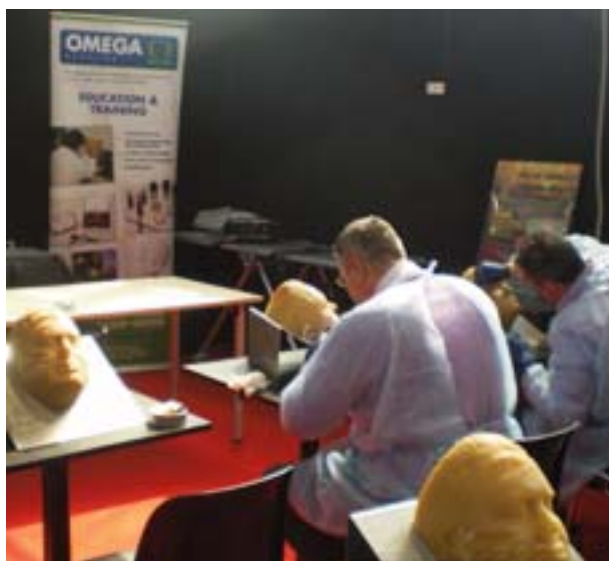
AULA DE TANATOPRAXIA

mesas de trabajo, asambleas gremiales, reuniones de comités directivos, reuniones de asociaciones internacionales, en fin, puedo asegurar que en estos días, Bolonia fue el centro del sector funerario internacional.