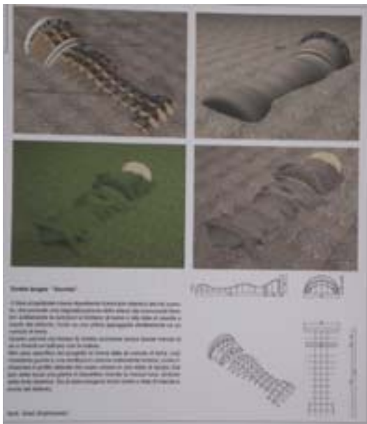
EXPOSICIÓN DE DISEÑO