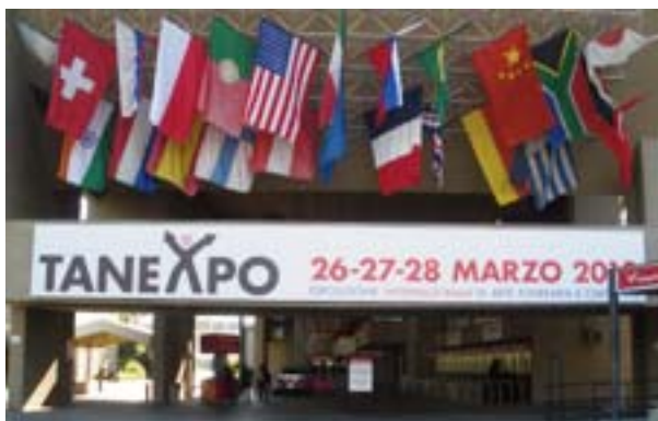
ENTRADA TANEXPO 2010

tendencias más futuristas en arquitectura funeraria: columbarios, espacios memoriales... presentados por famosos arquitectos.