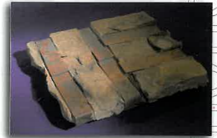
"Tumulus" - Alberto Gianfreda. Académie des Beaux-Arts de Brera - Département d'art et d'anthropologie du sacré