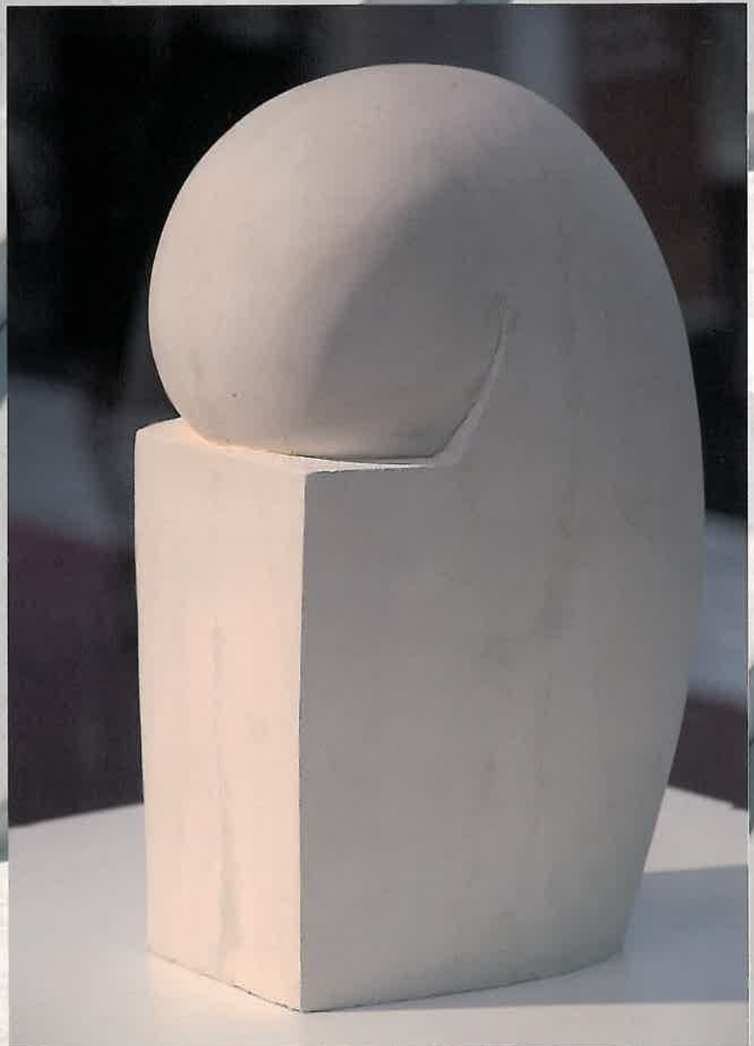
Adrian Craiuveianu - Urna cineraria.