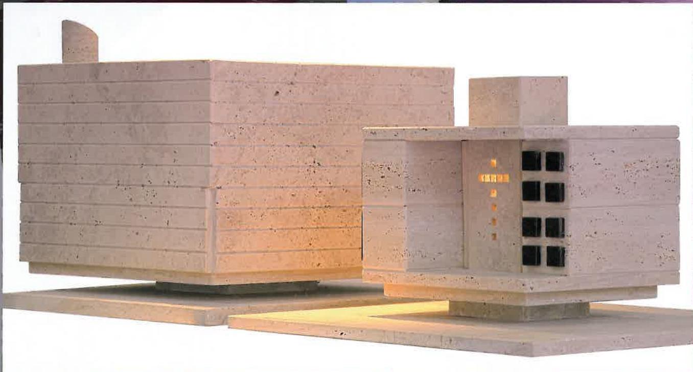
Antonino Bontempo - Tomba di famiglia (modelli dell'esterno e dell'interno).