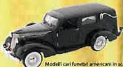
Modelli car funebre americani in scala

Lapidi provvisorie e provvisori da terra termoformati anche personalizzati