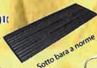
Sotto bara a norme