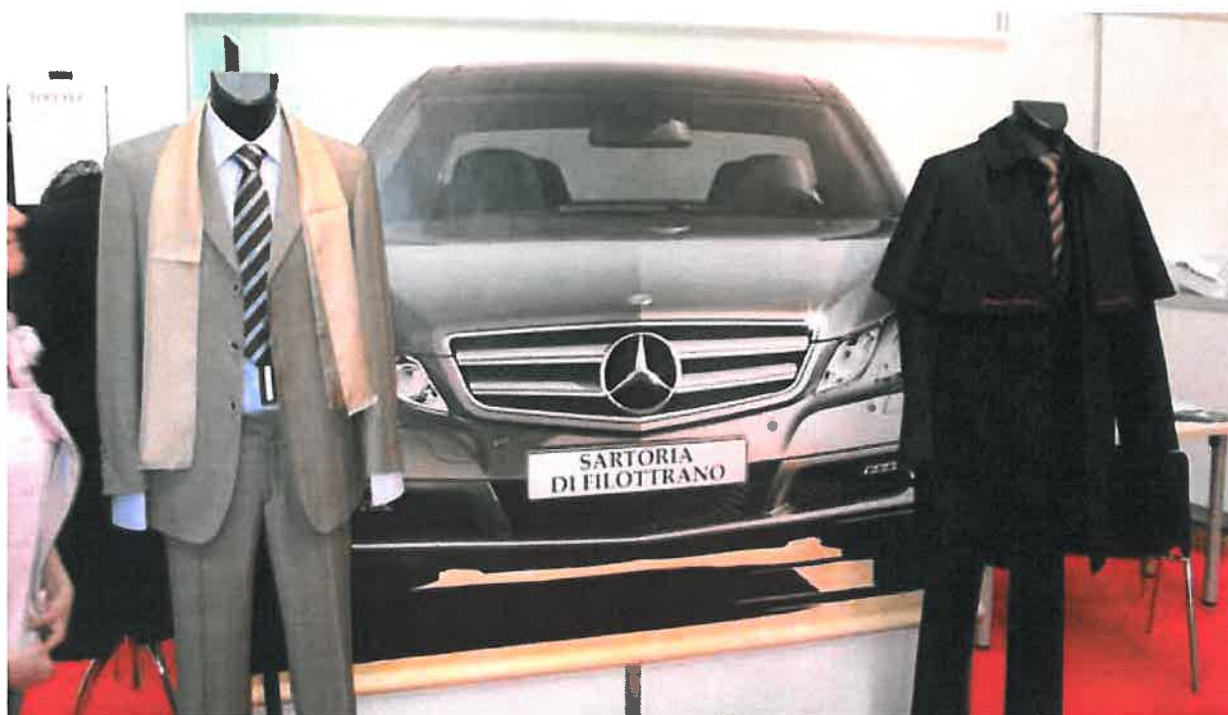
Qui sopra: lo stand della Sartoria di Filottrano.