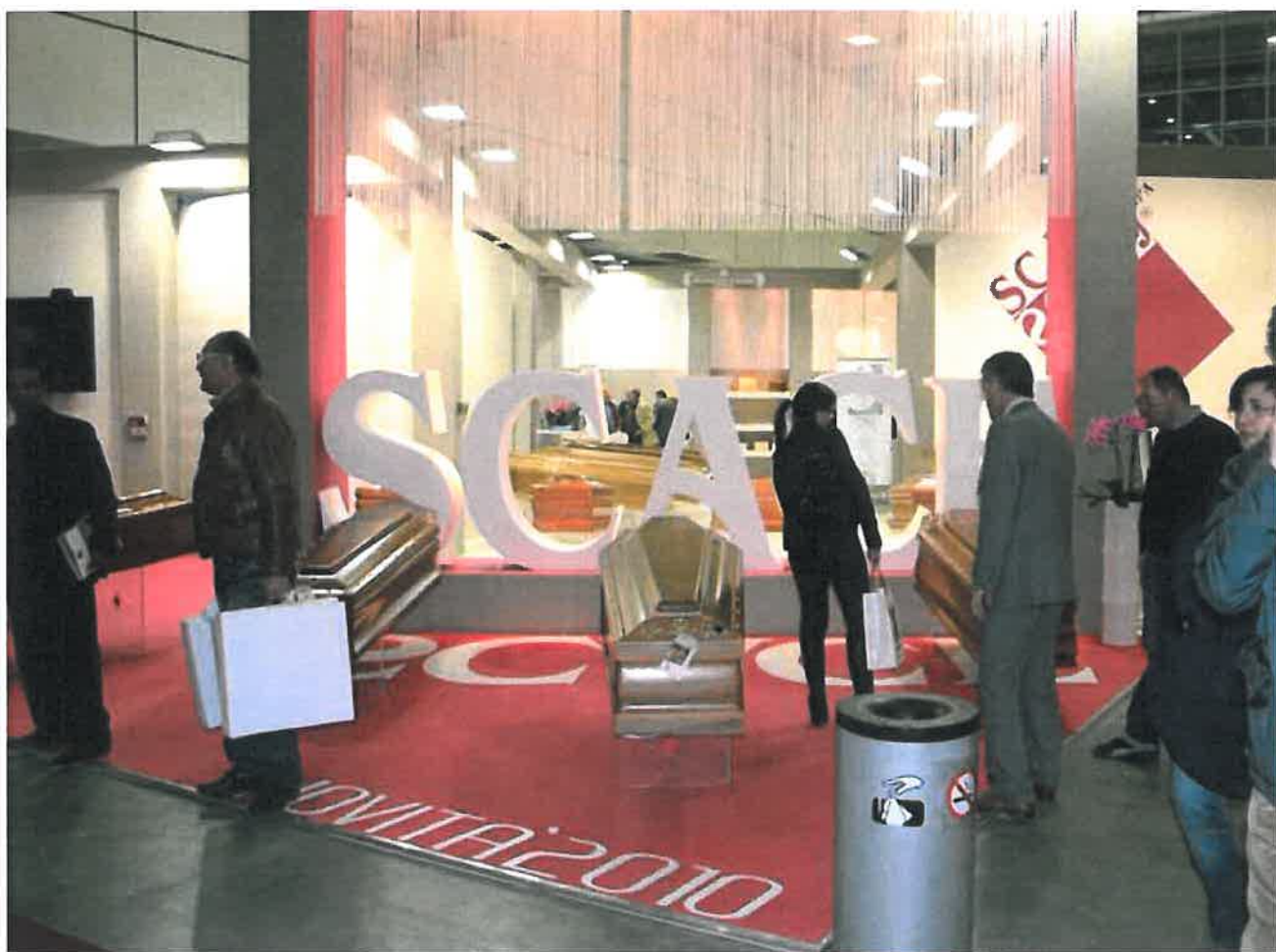
Sopra: lo stand della SCACF

azienda sono impiegati nella produzione 118 persone, mentre 12 si incaricano delle vendite e 2 seguono progetti e design. Il nostro mercato è caratterizzato da una domanda che si concentra nei primi tre mesi dell'anno a causa della maggiore mortalità, mentre sta leggermente