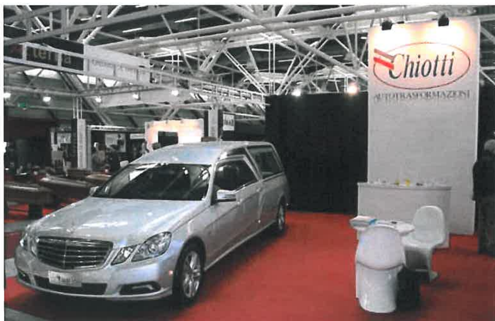
Qui sopra: lo stand della Chiotti Autotrasformazioni.

trasformatori italiani, ci collochiamo tra i cinque più importanti con un prezzo medio. Queste auto debbono avere come