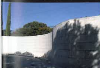
PREFABRICADOS PARA CEMENTERIOS