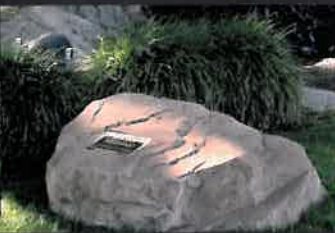
PERSONAL MONUMENTS™ PARA CENIZAS