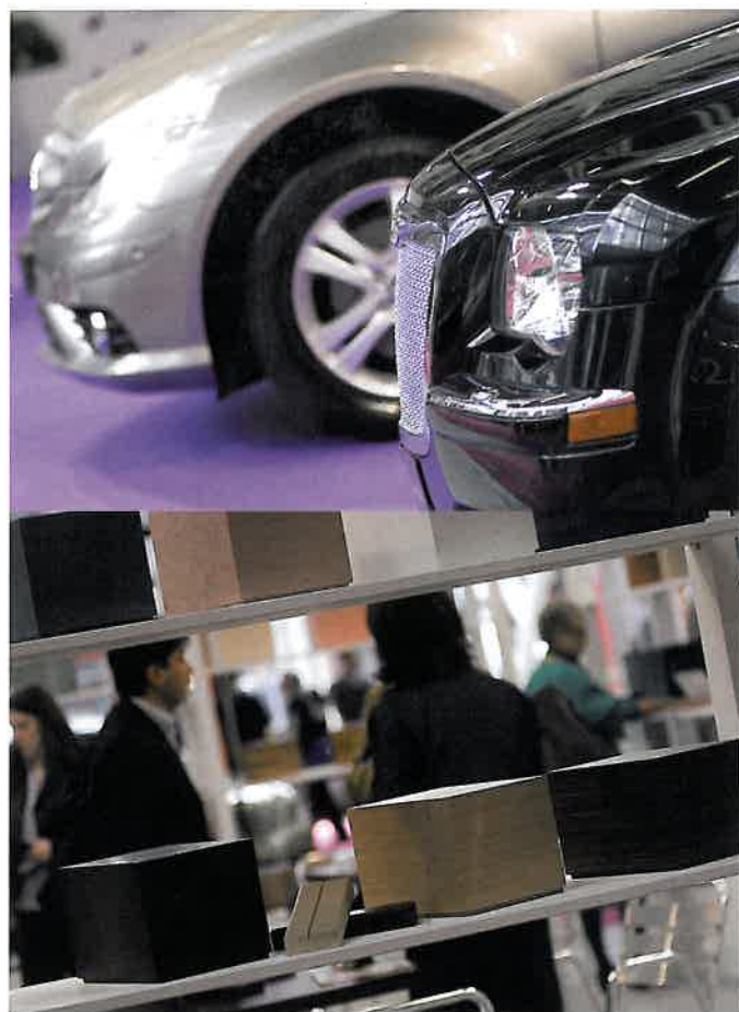
El diseño italiano, en todas sus vertientes y aplicado al ámbito funerario, volvió a ser protagonista de Tanexpo

no' reflejado en la mayoría de sus stands, y la variedad de propuestas en materia de artículos funerarios. En los tres pabellones que ocupó el certamen pudieron verse las últimas novedades de los diferentes subsectores representados de la industria funeraria: urnas, arte cementerial, arcas, escultura, mármoles, fotocerámica, vehículos funerarios, entre otros.