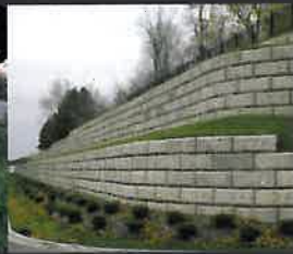
MURO DE CONTENCIÓN REDI-ROCK™