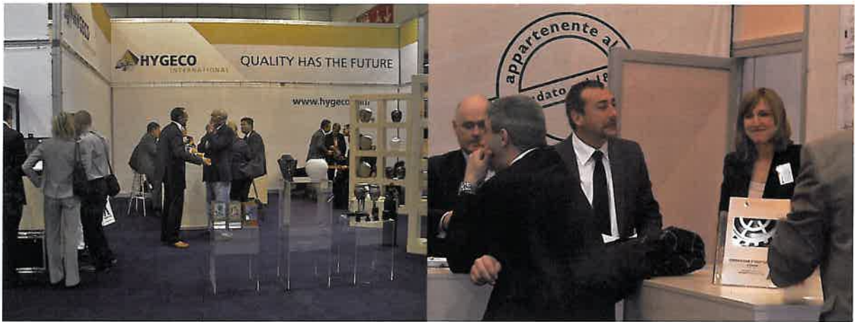
Stands de Hygeco International y Facultatieve Technologies