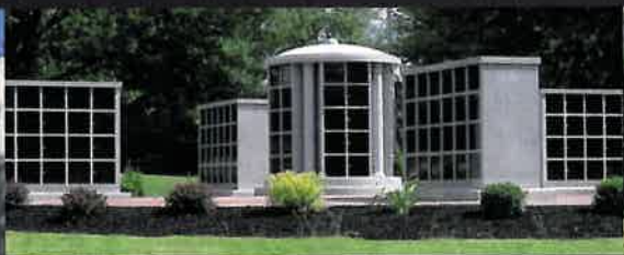
COLUMBARIOS DE GRANITO