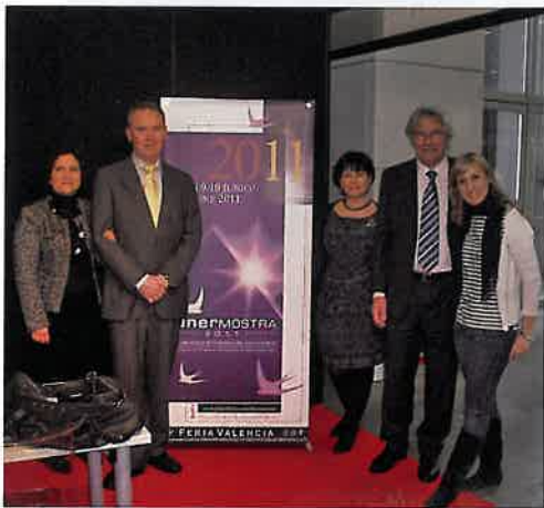
La Guía Funeraria; Funermos- tra; Indusauto; Limbo; Alaida; Eternal, y Evert, expositores españoles de Tanexpo 2010