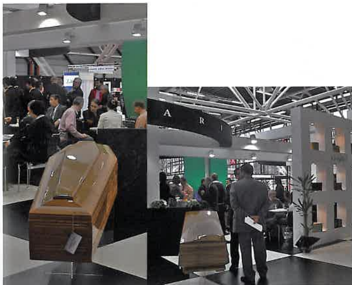
Stand de Ferrari, uno de los fabricantes de arcas líderes de Italia