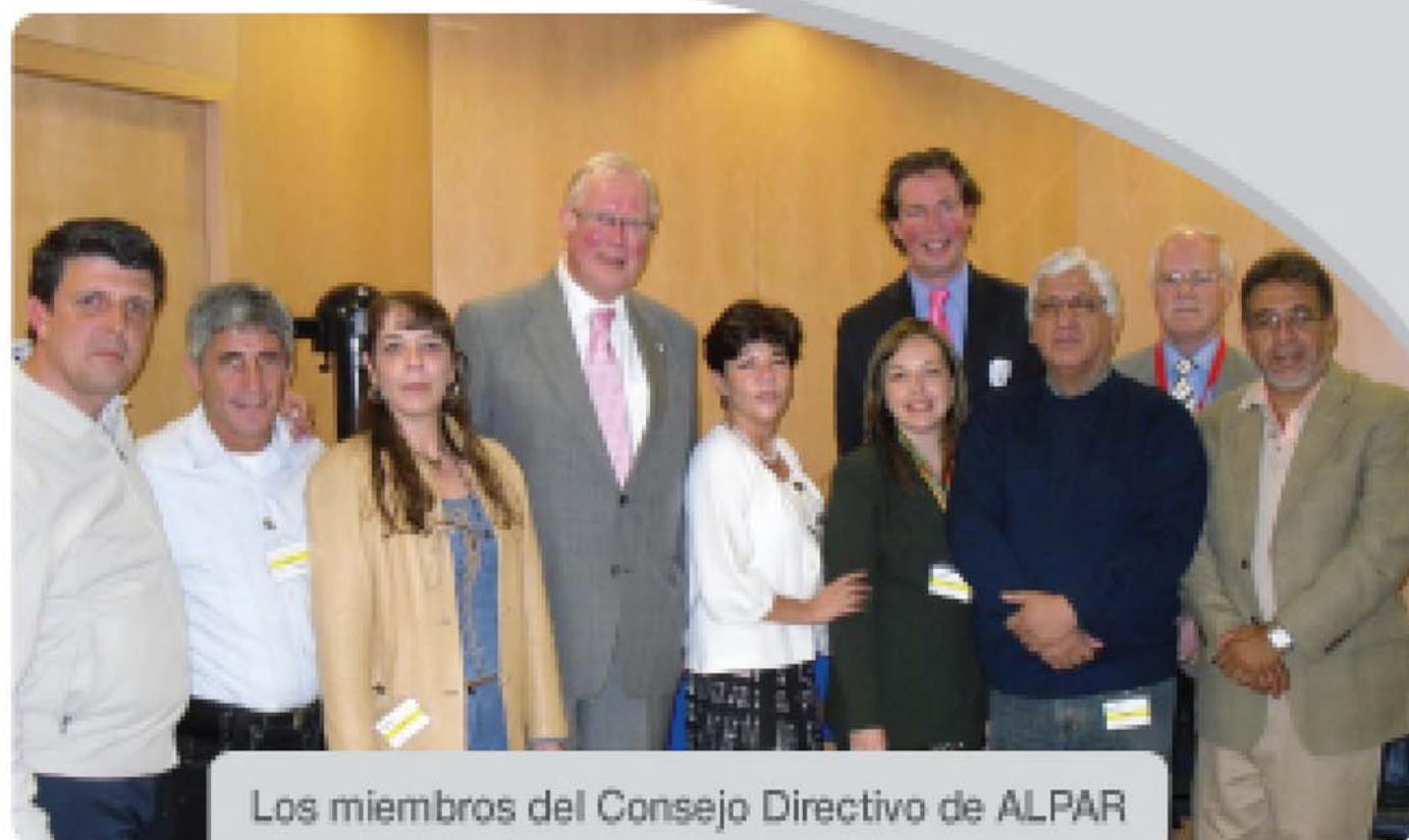
Los miembros del Consejo Directivo de ALPAR y los representantes de FIAT IFTA, al concluir el productivo encuentro.

Tanexpo 2010 contó con 16.000 visitantes, que recorrieron un área de 23.000 metros cuadrados, para visitar 210 expositores de productos y servicios novedosos y de calidad.