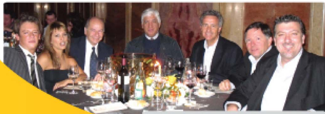
Participantes de ALPAR en la cena para los invitados internacionales.