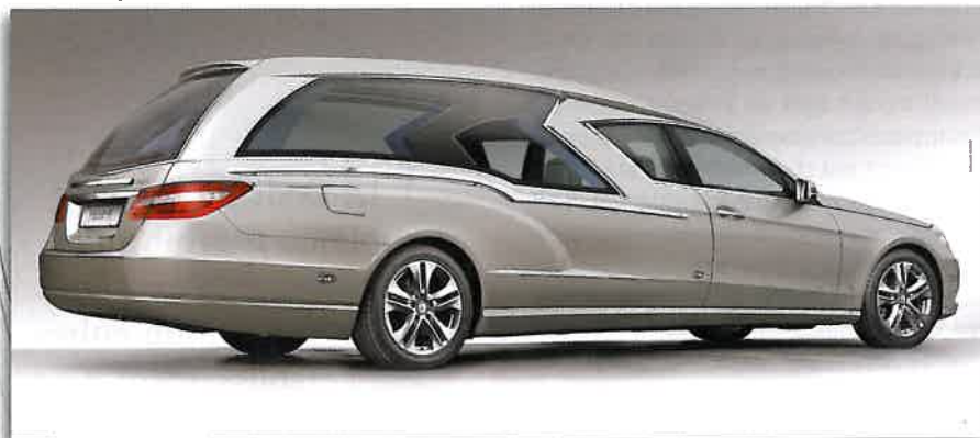
Biemme Special Cars.

Bertolotti peut se vanter de plus d'un quart de siècle d'expérience dans les réalisations de très haute qualité : des accessoires en bronze les plus classiques à ceux, très innovants et écolo-