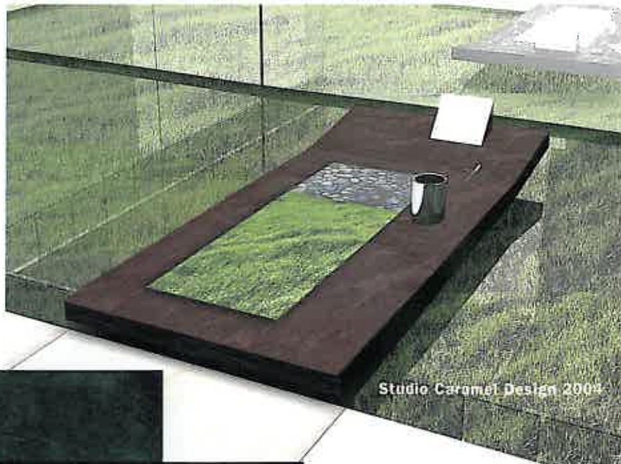
Studio Caramel Design 2004

so dell'altro e come reminiscenza della materia. I progetti in mostra saranno immaginati nell'ottica di una matematica inesorabile, una geometria che "pre-vede" e che anticipa la perfezione di ciò che apparirà in cielo alla fine del tempo. La luce del vero è anche la