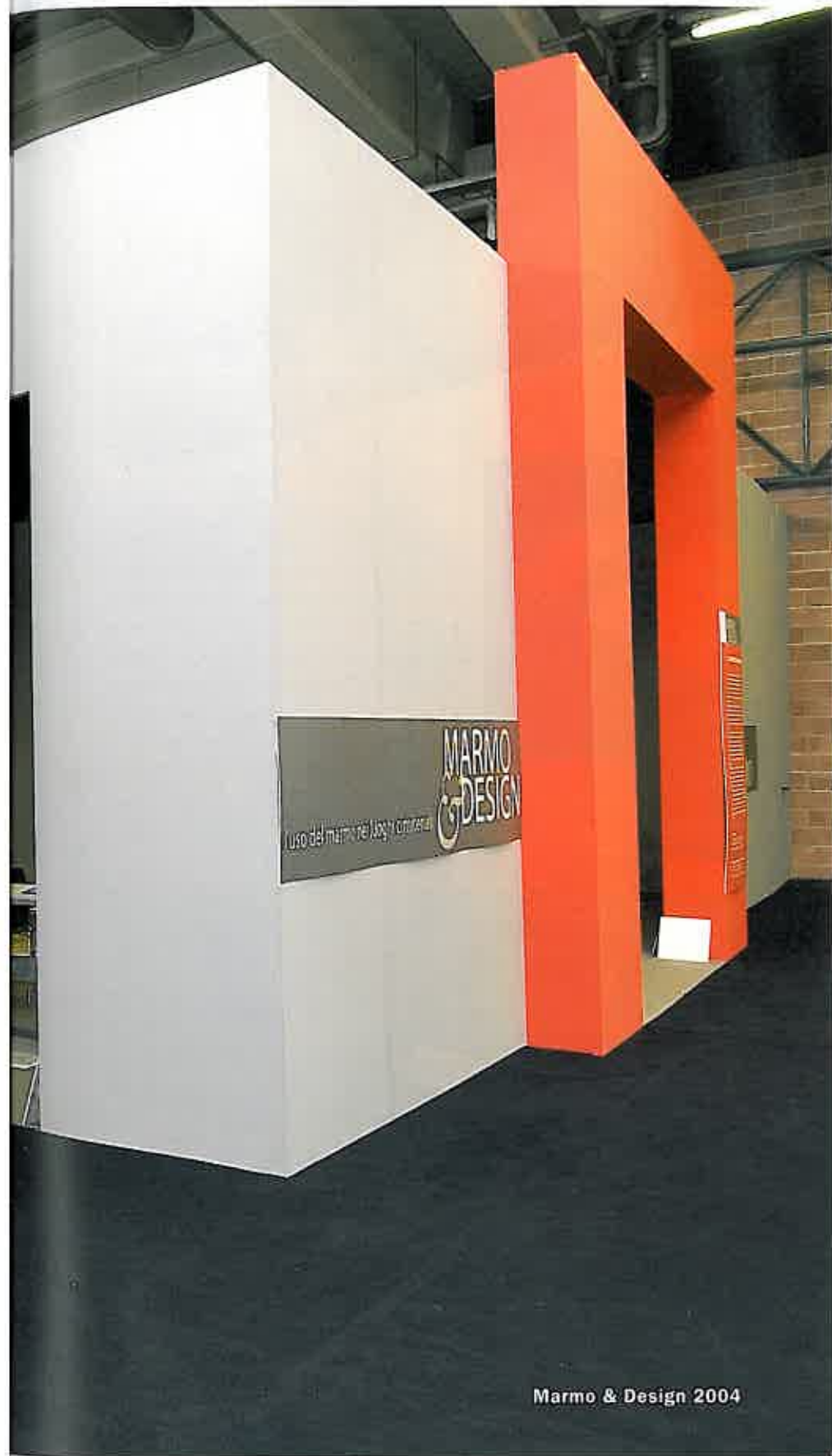
Marmo & Design 2004