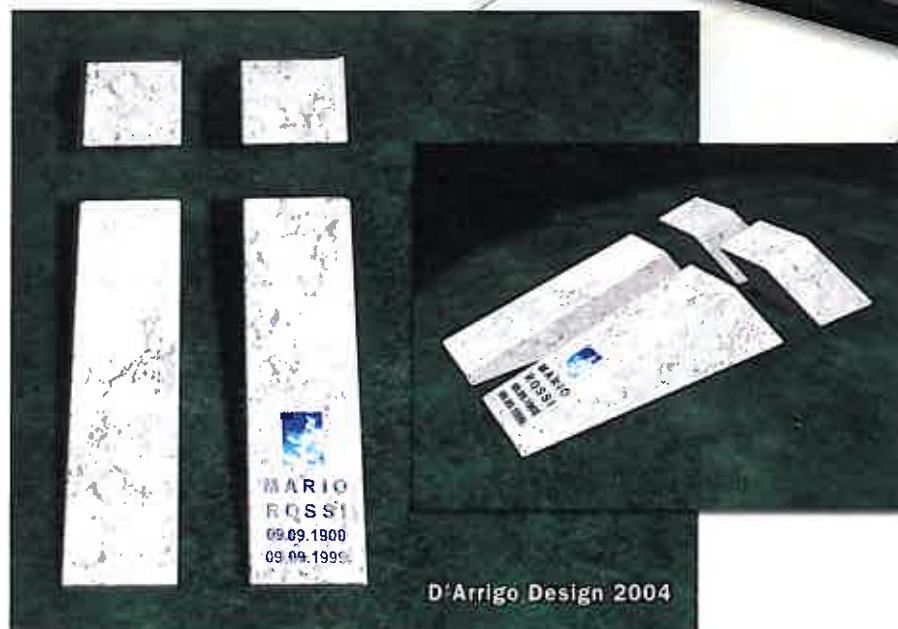
D'Arrigo Design 2004

contatto fra il mondo della ricerca e le più importanti realtà produttive del nostro Paese percorrendo i tempi e contribuendo, in perfetta aderenza agli obiettivi della manifestazione bolognese, allo sviluppo ed alla affermazione del made in Italy nel segno della innovazione e della modernità.